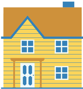
Respectez la consigne de rester à la maison