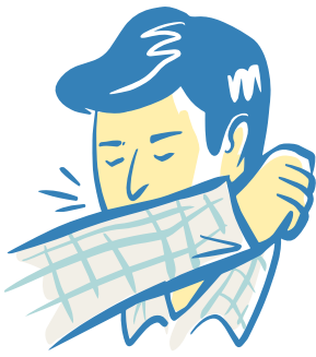
Toussez dans votre coude