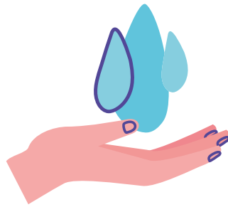
Lavez vos mains