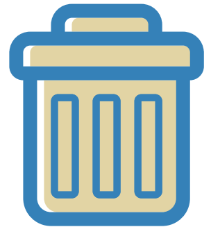
Jetez vos mouchoirs